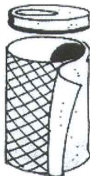
composter in rete fai da te

I contenitori per il compostaggio devono essere posizionati all'aperto e poggiare su suolo naturale.